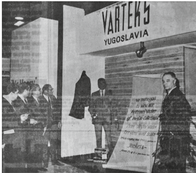
Izložba u Londonu – još jedan uspješan korak u osvajanju engleskog tržišta

jeve. Baš naprotiv, vrijedni strojevi davno su je