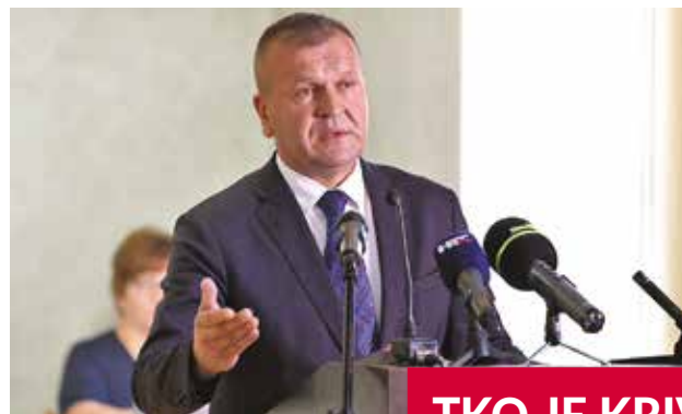
TKO JE KRIV ZA STEČAJ?

- Zakon o strateškim investicijskim projektima Republike Hrvatske, za “strateške” projekte kao što je Varteks, propisuje rok od 15 dana da tijelo nadležno za zaštitu spomenika kulture propiše provedbu posebnih postupaka zaštite. Ako to ne učini, ima još 15 dana. Ako i tada ništa ne učini nije jasno što se događa tako da je cijela ta zaštita na klimavim nogama – napisao je Strahonja.